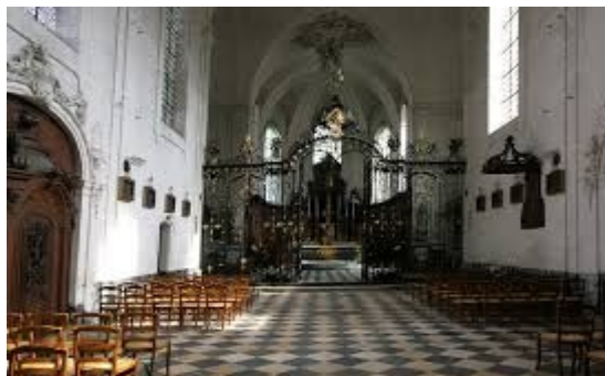
L'abbatiale de Valloires

En 1138, Guy de Ponthieu accorde aux moines de l'ordre de Cîteaux la fondation de leur septième « fille ». Les moines s'établissent définitivement à Valloires, dans la vallée de l'Authie, en 1158. Au sommet de sa prospérité, aux XIIe et XIIIe siècles, l'abbaye accueille une centaine de moines. Cette prospérité permet la construction d'une première abbatiale de style gothique dès 1226.