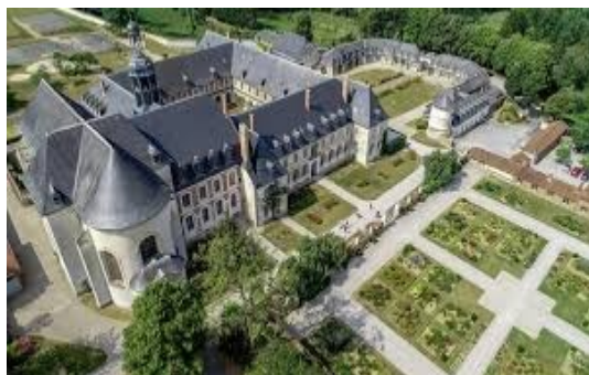
Vue générale de l'abbaye

Départ NATION à 7 heures 45 en autocar en direction de l'Abbaye de Valloires où nous sommes attendus à 11 heures