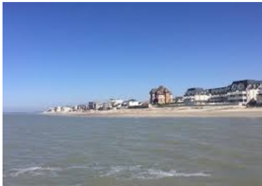
La plage du Crotoy

Jadis se dressait une place forte où Jeanne d'Arc fut enfermée avant d'être conduite à Rouen. De 1865 à 1870 Jules Verne y séjourna. Vinrent ensuite Toulouse-Lautrec et Seurat. A la fin du XIXème siècle, le parfumeur Pierre Guerlain entreprit de faire du Crotoy « la seule plage du Nord située au Sud ». L'arrivée du train, dans les années 1880, avait déjà renforcé la réputation de la station, avec ses villas de style anglo-normand. La plage est le domaine du cerf-volant et du char à voile.