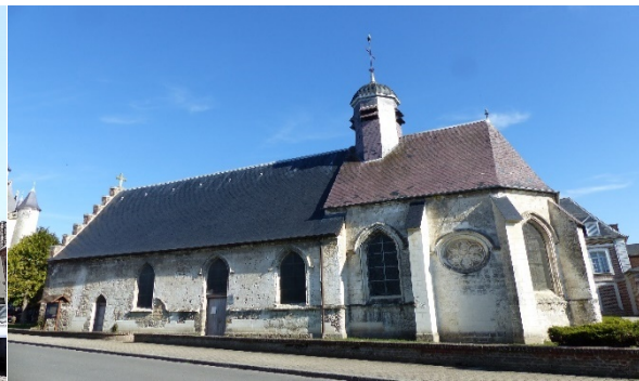
La Chapelle de l'Hospice

Port de mer au début du Moyen Age, Rue fut une place forte du comté de Ponthieu jusqu'au 17 ème siècle. Sa chapelle abrite une relique liée à une mystérieuse légende. Son puissant beffroi symbolise les libertés communales. Capitale du Marquenterre, c'est le paradis des chasseurs et des pêcheurs. La Chapelle du Saint-Espirit de style gothique flamboyant doit son raffinement aux dons faits par les fidèles lors du pèlerinage du Crucifix miraculeux, mais aussi de grands donateurs tels les Ducs de Bourgogne et Louis XI. Les voûtes de la chapelle témoignent du goût des 15 ème et 16 ème siècles pour la sculpture décorative qui forme une dentelle de pierre d'une rare délicatesse et virtuosité.