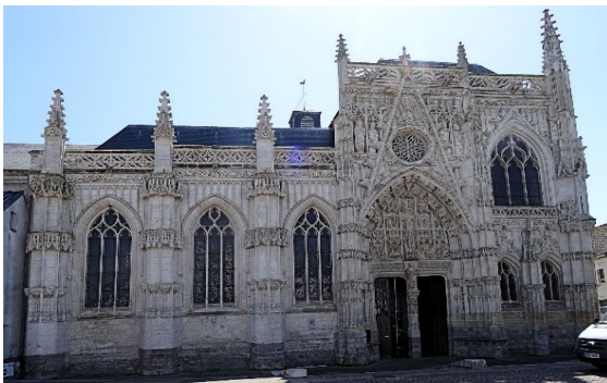
La Chapelle du Saint-Espirit