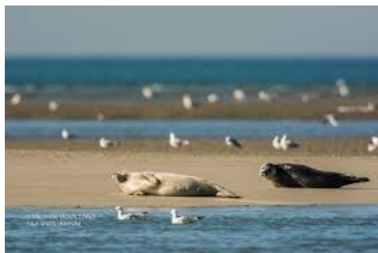
Les phoques à la pointe du Hourdel

Selon les horaires des marées et si le temps imparti est suffisant, un crochet par la pointe du Hourdel nous permettra peut-être d'apercevoir quelques phoques veaux marins qui se vautrent à marée basse sur les « reposoirs » de sable qui bordent l'estuaire.