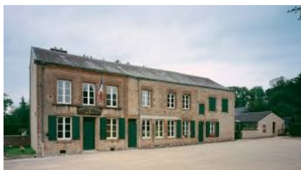
Maison de la dernière cartouche

Nous nous dirigerons ensuite vers Bazeilles pour la visite de la Maison de la Dernière Cartouche . Cette localité à la périphérie de Sedan, synonyme de désastre militaire, a été le lieu d'un épisode émouvant de la bataille de Sedan. Le 31 août et le 1 er septembre 1870, 200 marsouins résistèrent farouchement aux troupes du 1 er corps bavarois. Ayant épuisé leurs dernières munitions, les défenseurs acceptèrent de se rendre. Le lendemain Sedan capitulait.