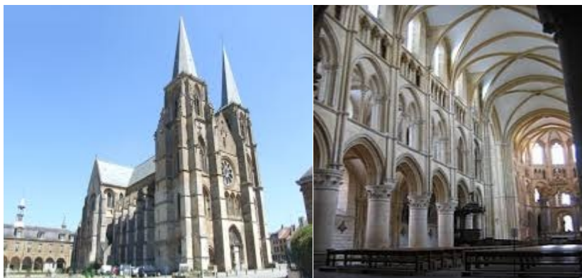
Mouzon abbatiale Notre-Dame

Cette agréable localité resserre ses vieilles maisons de calcaire jaune sur les rives de la Meuse. Succédant à une première église, l'abbatiale Notre-Dame fut bâtie de 1190 à 1231, à l'exception des tours aux 15 ème et 16 ème siècles. L'abbatiale fut vendue à la Révolution et devint un hôpital. Des restaurations importantes ont été effectuées à la fin du 19 ème . Elle présente un tympan richement sculpté.