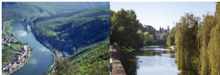
La vallée de Meuse

Dans la vallée de la Meuse, la forge est une longue histoire qui débute avec les Celtes. Dès le Moyen Age, la vallée de la Meuse accueille forges et fourneaux, initiant une longue tradition industrielle de la métallurgie. A Bogny sur Meuse le musée de la métallurgie ardennaise est installé dans une ancienne usine.