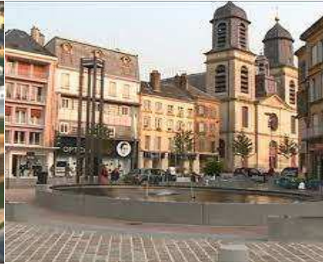
Le cœur de ville et St Charles Borromée