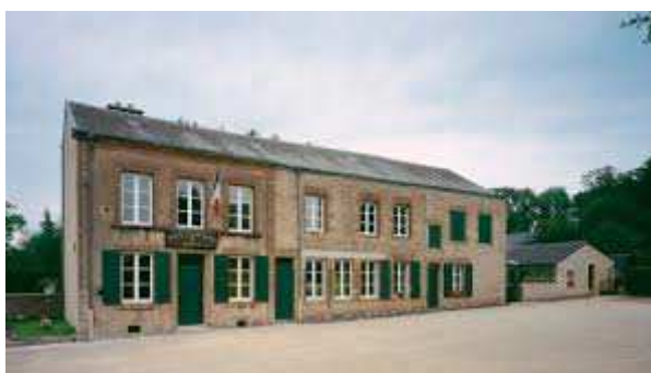
Maison de la dernière cartouche

Nous nous dirigerons ensuite vers Bazeilles pour la visite de la Maison de la Dernière Cartouche . Cette localité à la périphérie de Sedan, synonyme de désastre militaire, a été le lieu d'un épisode émouvant de la bataille de Sedan. Le 31 août et le 1 er septembre 1870, 200 marsouins résistèrent farouchement aux troupes du 1 er corps bavarois. Ayant épuisé leurs dernières munitions, les défenseurs acceptèrent de se rendre. Le lendemain Sedan capitulait.