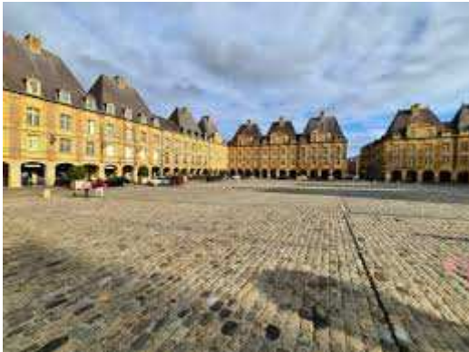
La Place Ducale

Visite de la cité ducale de Charleville et de sa remarquable place aux hauts toits d'ardoise de Fumay. Mézières, plus "administrative", avec la préfecture (ancienne Ecole royale du génie au XVIIIème siècle) et son hôtel de ville Art déco, ne manque pas d'atouts non plus !