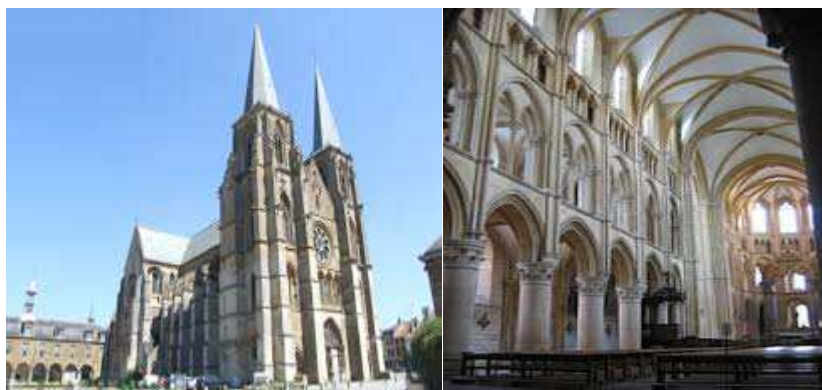
Mouzon abbatale Notre-Dame

Cette agréable localité resserre ses vieilles maisons de calcaire jaune sur les rives de la Meuse. Succédant à une première église, l'abbatale Notre-Dame fut bâtie de 1190 à 1231, à l'exception des tours aux 15 ème et 16 ème siècles. L'abbatale fut vendue à la Révolution et devint un hôpital. Des restaurations importantes ont été effectuées à la fin du 19 ème . Elle présente un tympan richement sculpté.