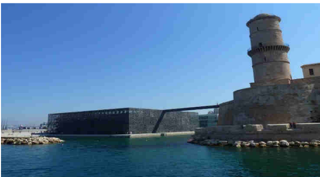
La Tour Saint-Jean et le Mucem

Au cours de travaux réalisés en 1967 pour la construction d'un centre commercial, d'importants vestiges archéologiques ont été mis au jour. L'ampleur de cette découverte concernait les fortifications grecques de Marseille, des enclos funéraires et une partie de l'ancien port. Un jardin a été aménagé pour mettre en valeur ces différents vestiges. Les objets découverts sont exposés dans le musée. Plongée dans 26 siècles d'histoire.