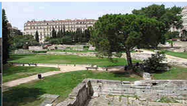
Le Jardin des Vestiges