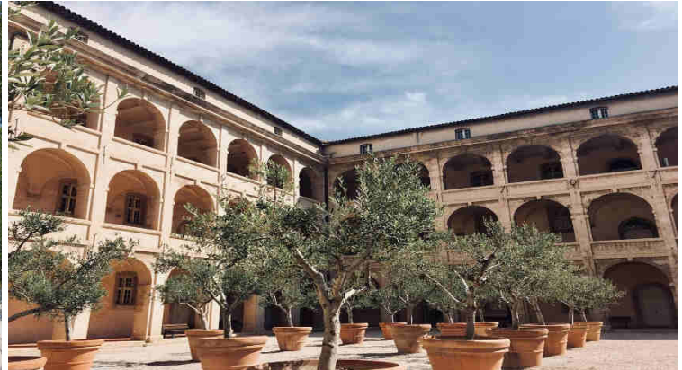
La Vieille Charité