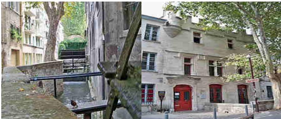
Maison « Quatre de Chiffre »

C'est sans doute l'un des plus pittoresques de la vieille ville. La rue des Teinturiers suit le cours d'un bras de la Sorgue qui alimentait autrefois les douves de l'ancien rempart du XII ème siècle. Elle était au XVII ème siècle plantée de mûriers. L'eau était utilisée au XVIII ème siècle pour les besoins de fabriques d'indienne, industrie particulièrement prospère à cette époque. Réactivée au XIX ème siècle, elle périclita pour laisser place à d'autres ateliers utilisant la force motrice de la Sorgue au moyen de grandes roues à aube. On peut encore voir une très belle maison gothique dite du « Quatre de Chiffre », ainsi que l'unique vestige de l'ancien couvent des Cordeliers : la chapelle absidiale. A mi-parcours de la rue se dresse la chapelle des Pénitents gris, seule confrérie encore en activité à Avignon et la plus ancienne d'Avignon.