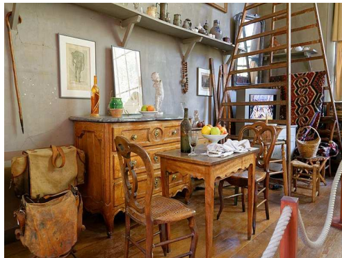
L'atelier de Paul Cézanne

Nous empruntons un transport local pour nous rendre à l' atelier des Lauves situé à l'écart du centre -ville. C'est ici, sur la colline des Lauves, parmi les objets qui lui étaient chers, son mobilier, son matériel de travail que nous retrouverons l'environnement de création de Paul Cézanne. De 1902 à sa mort en 1906, Cézanne travaille tous les matins dans cet atelier lumineux, berceau de dizaines d'œuvres aujourd'hui conservées dans les grands musées du monde.