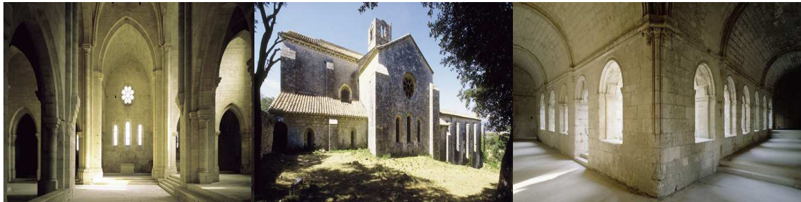
L'abbaye de Silvacane

L'abbaye fut fondée en 1144 par Guillaume de la Roque et Raymond de Baux qui en firent don aux cisterciens. L'abbaye prospéra jusqu'en 1357 date où un pillage et un incendie marquèrent son déclin. Elle fut acquise par le chapitre de la cathédrale Saint-Sauveur en 1443. Vendue comme bien national à la Révolution, elle fut convertie en ferme. L'Etat a racheté les bâtiments.