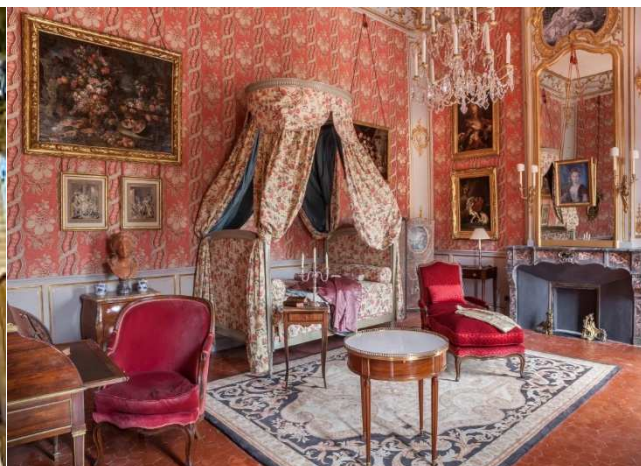
Chambre de Pauline de Caumont