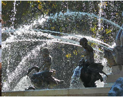
Fontaine Cours Mirabeau

Dîner et nuit à l'hôtel Saint-Christophe