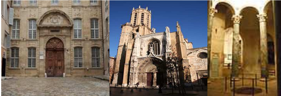
Le musée Granet