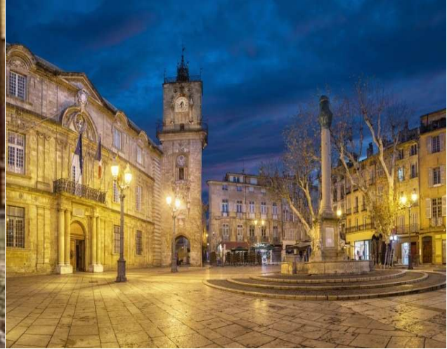
Place de l'Hôtel de Ville

Dîner et nuit à l'hôtel Saint-Christophe