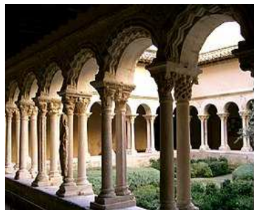
Le cloître Saint-Sauveur

La cathédrale Saint-Sauveur est une curieuse église où voisinent tous les styles du V ème au XVI ème siècle. La façade surprend. A droite une partie en roman provençal appartenant à la vieille église ; au centre une partie en gothique flamboyant début XVI ème , enfin à gauche le clocher gothique (XV ème /XVI ème siècles). L'intérieur est un véritable musée : on peut y voir entre autres le tombeau de Saint-Mitre (sarcophage du V ème siècle), le baptistère (V ème siècle) comporte une cuve baptismale entourée de 8 colonnes romaines supportant un dôme Renaissance, le triptyque du Buisson Ardent – primitif du 15 ème siècle – par Froment peintre de la cour du Roi René.