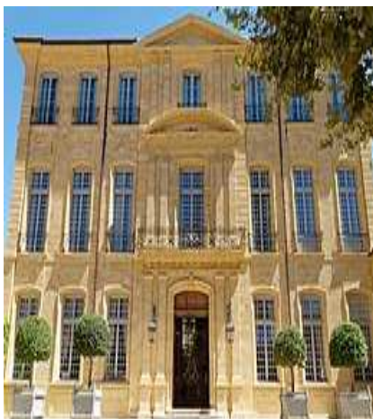
Façade Hôtel de Caumont