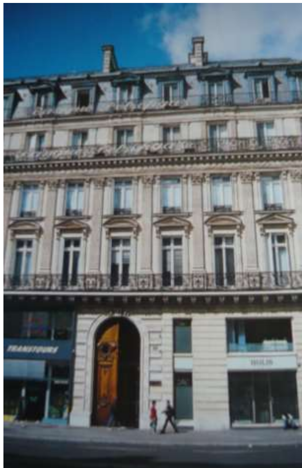
Immeuble « type »

Leur uniformité tient surtout à une mode et à des livres d'architectures qui reprenaient les mêmes plans et élévations.