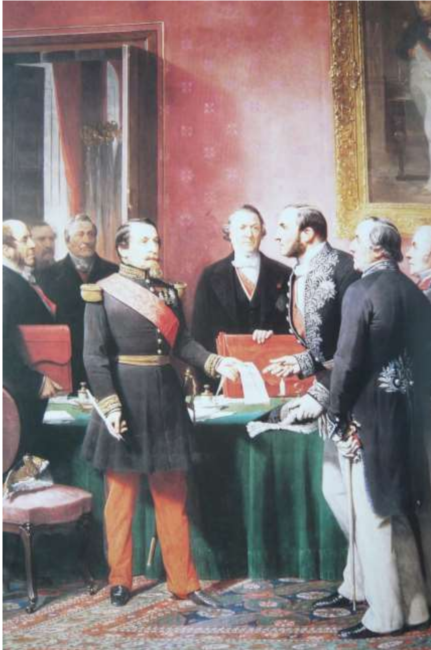
Napoléon remettant au baron Haussmann

le décret d'annexion des communes limitrophes 1865