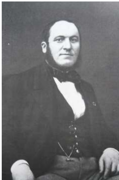
George Eugène Haussmann

George Eugène Haussmann est né rue du Faubourg du Roule en 1809.