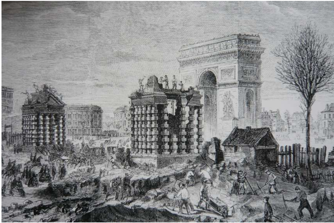
Démolition de la barrière de l'Etoile