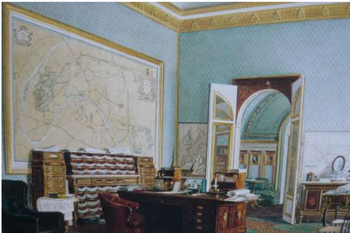
Le bureau de l'empereur aux Tuileries

dit l'Empereur quand il reçoit les délégations de propriétaires pour parler des aménagements à réaliser.