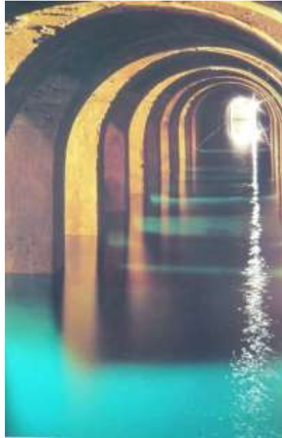
Bassin réservoir de Montsouris

Afin d'aider les habitants de Paris à cultiver une hygiène plus conforme au besoin de la bonne santé, l'eau claire va arriver sur les éviers et les eaux usées vont être évacuées grâce à de complexes installations : aqueducs, bassins, réseaux d'égouts