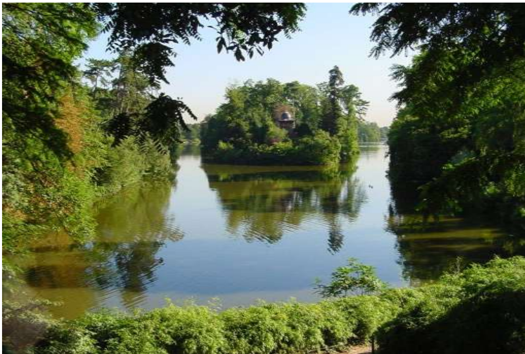
Bois de Boulogne

Les parcs, squares et bois, véritables « poumons » de la capitale deviennent des lieux de promenades fréquentés par tous.