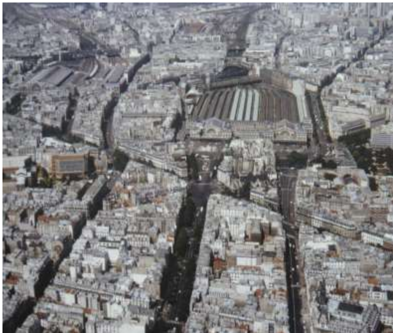
Vue aérienne du quartier de la gare de l'Est

On creuse et on perce de longues avenues.