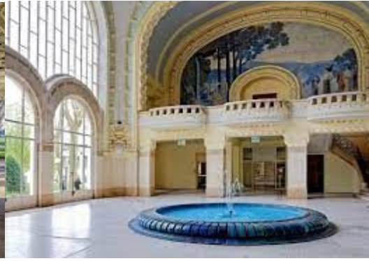
Etablissement thermal Art nouveau