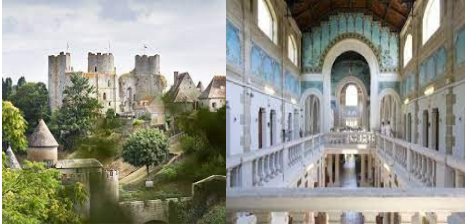
Bourbon l'Archambault : le château et les thermes

Fin des visites vers 16h45 pour regagner Moulins et prendre le train de 17h31.