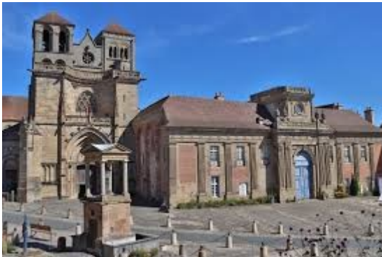
Priorale de Souvigny, nécropole des Bourbons

Visite d'un atelier d'émail sur lave où nous découvrirons les techniques d'un procédé, apparu sous Louis-Philippe, et popularisé à Paris en 1839 avec les fameuses plaques de rues bleues et vertes à lettre blanches.