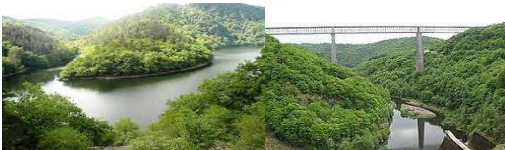
Les gorges de la Sioule