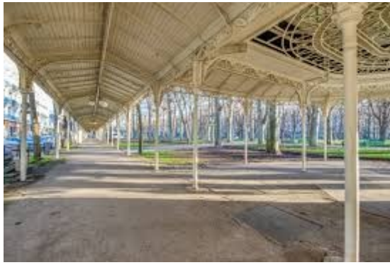
Galleries autour du parc thermal