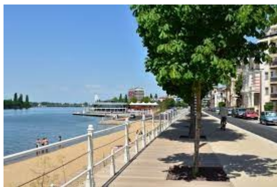
Les rives du lac d'Allier