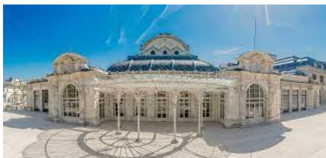
L'Opéra de Vichy

820 € - pas de supplément chambre individuelle – Assurance annulation facultative 45€