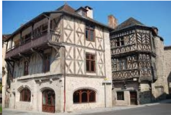
Maisons anciennes à Chateldon