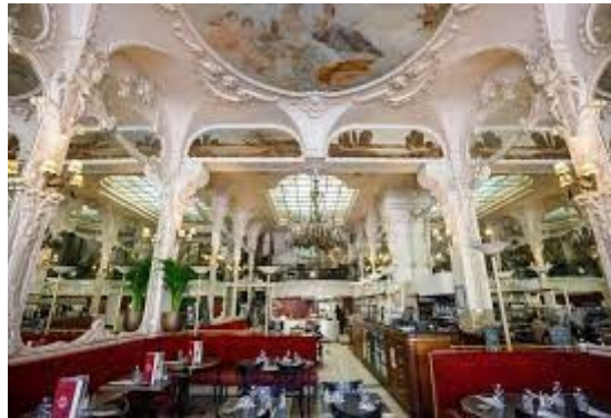
Brasserie le Grand Café à Moulins

Déjeuner à la brasserie historique Le Grand Café, au magnifique décor de 1899, où vinrent Coco Chanel, Brassens ou Bobby Lapointe.