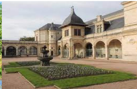
Pavillon Anne de Beaujeu