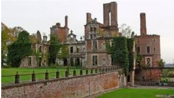
Le château de Randan

Retour à Vichy en passant par le pittoresque village de Chateldon et ses nombreuses maisons anciennes (du XVème au XVIème siècle), dominées par son château des XVème et XIXème siècles (visite extérieure)