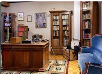
Bureau de Valéry Larbaud