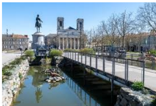
La Roche sur Yon

Depuis quelques années La Roche sur Yon connaît un fort développement démographique et économique notamment dans le secteur tertiaire et affiche le plein emploi.