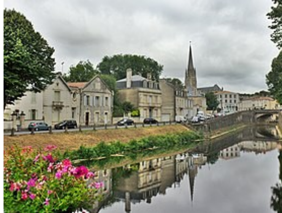
Fontenay le Comte

Découverte à pied de la ville de Fontenay-le-Comte