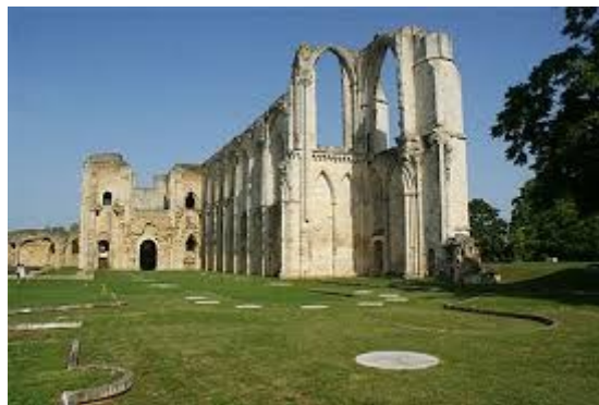
L'abbaye de Maillezais

A la suite de la Révolution, les murs encore debout sont vendus pour servir de carrière de pierre. Classée Monument Historique en 1923, Maillezais est sauvée de la destruction totale. Elle est aujourd'hui la propriété du Conseil Départemental qui assure sa restauration et sa mise en valeur.