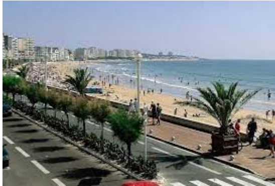
Les sables d'Olonne

13 AU 15 SEPTEMBRE AVEC MARIE-JEANNE LUNEL