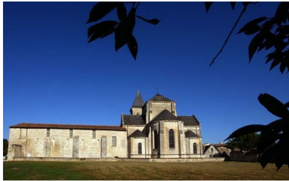
Abbaye de Nieul sur l'Autise

Après le déjeuner nous commencerons nos visites par l'Abbaye de Nieul sur l'Autise