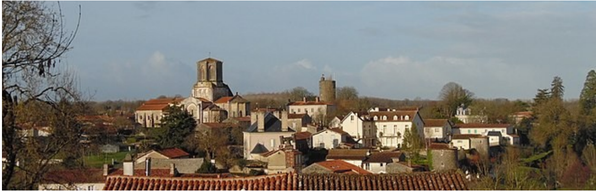
Vue générale de Vouvant

Au sein de la forêt de Vouvant-Mervent la rivière Mère s'enroule autour de Vouvant, dessinant un fossé naturel de défense. Guillaume IV d'Aquitaine fit bâtir au 11 ème siècle un château, une église et un monastère. On peut admirer aujourd'hui de l'église le portail du 11 ème , l'abside du 12 ème et la crypte du 11 ème . Le château n'a conservé que son donjon, la tour Mélusine, des fragments de remparts et une poterne du 13 ème . Un pont roman enjambe les deux rives de la Mère. Un personnage hante encore les esprits : la Fée Mélusine. La beauté du village inspire et attire de nombreux artistes