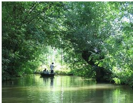
Le Marais Poitevin

Une promenade en barque commentée nous permettra d'observer la faune et la flore ainsi que l'habitat traditionnel et les métiers qui y survivent encore.