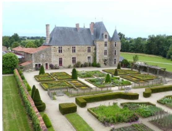
Le logis de la Chabotterie

Nous nous rendrons ensuite au Logis de la Chabotterie haut lieu de la Guerre de Vendée. Le logis fut le témoin de l'arrestation du général vendéen de Charrette le 23 mars 1796. Ce type de demeure se répand dans le paysage vendéen entre le 15 ème et le 18 ème siècle. La construction remonte au milieu du 15 ème siècle. Autour de sa cour d'honneur sont étroitement imbriqués dépendances agricoles, logements des domestiques et maison noble. Racheté par le Département, les travaux de restauration redonnent au logis l'aspect qu'il avait à la veille de la Révolution Française. L'aménagement intérieur, conçu à partir d'archives, présente exclusivement des objets authentiques antérieurs aux années 1790.