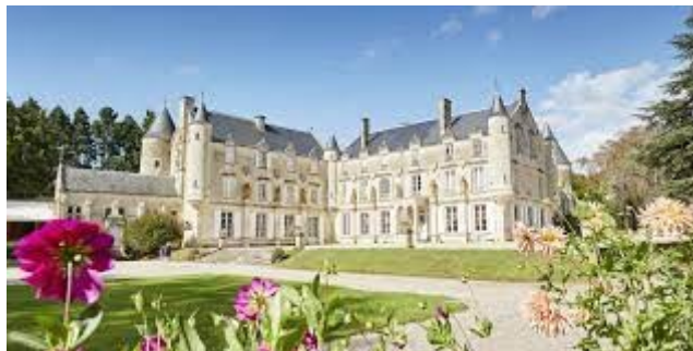
Le château de Terre-Neuve

Nous dirigerons vers Fontenay-le-Comte, notre lieu de séjour, pour y visiter le château de Terre-Neuve