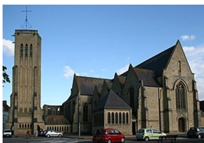
Bergues : l'église Saint-Martin reconstruite

Son canal intérieur lui a valu le surnom de « petite Bruges du Nord ». On y retrouve l'atmosphère de la cité flamande avec ses rues sinueuses. Ancienne rivale de Dunkerque, la ville fut très endommagée en 1940. Brillamment reconstruite avec ses demeures de briques ocre jaune elle conserve un caractère sobre et harmonieux. Elle a connu en 2008 une mise en lumière médiatique pour avoir accueilli le tournage du film « Bienvenue chez les Ch'tis ». L'enceinte fortifiée est percée de quatre portes et cernée de douves. Le Belfroi d'origine construit au 16 ème siècle, fut dynamité par les Allemands en 1944. Sa reconstruction de 1958 à 1961 a conservé les grandes lignes initiales. Il possède un carillon de 50 cloches.