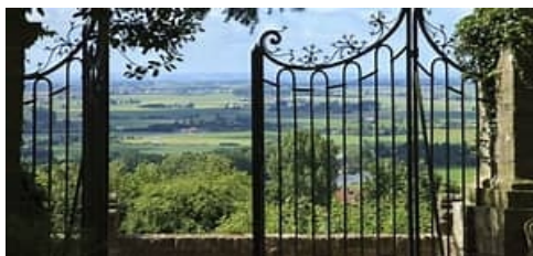
Panorama sur la ville