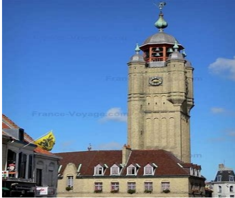
Le Belfroi de Bergues

Partagées entre la France, la Belgique et les Pays-Bas les Flandres ont connu une histoire mouvementée, marquée par la draperie, les villes, les révoltes et les guerres.