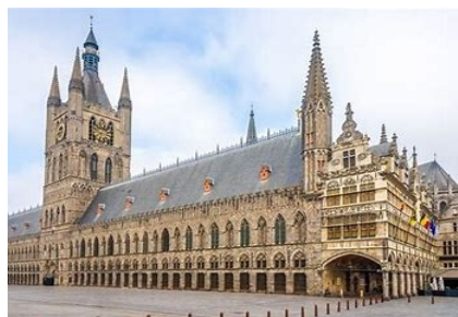
Ypres : Halle aux draps

Au 12 ème et 13 ème siècle Ypres fut une grande ville drapière comme en témoigne sa halle aux draps, reconstruite dans le style primitif. La cathédrale Saint-Martin, elle aussi reconstruite dans le style d'origine (13 ème -15 ème ) abrite un polyptique du 16 ème siècle et des statues d'albâtre du 17 ème couronnant la chapelle baptismale.