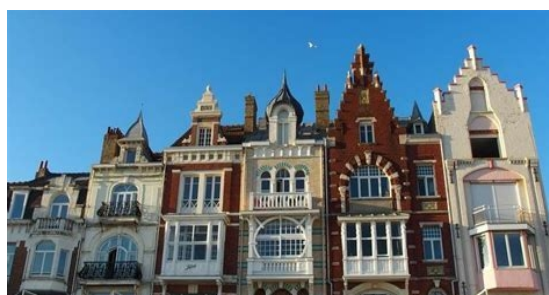
Villas balnéaires Malo-les-Bains