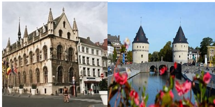
Courtrai : Hôtel de ville

L'hôtel de ville montre une façade flamboyante. Le Béguinage est un îlot de calme au cœur de la ville. Il fut fondé en 1242 par la comtesse de Flandre Jeanne de Constantinople. L'église Notre-Dame fut érigée au début du 13 ème siècle par Baudouin de Constantinople. On peut y voir une projection de 18 minutes relatant la bataille des Eperons d'Or. Cette bataille eut lieu sous les murs de Courtrai le 11 juillet 1302 opposant les Flamands contre l'hégémonie du roi de France. La chevalerie de Philippe le Bel y fut battue. Les éperons ramassés sur le champ de bataille ont tapissé les voûtes de l'église jusqu'en 1382 date à laquelle ils ont été repris par l'armée française cette fois victorieuse des Flamands