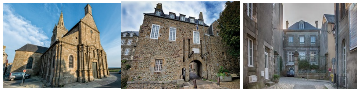
Notre-Dame du Cap Lihou - Grande Porte – Hôtel particulier

Ce sont les Anglais qui sont à l'origine de sa création au XVème siècle. La construction et la reconstruction des fortifications s'étendront sur plusieurs siècles