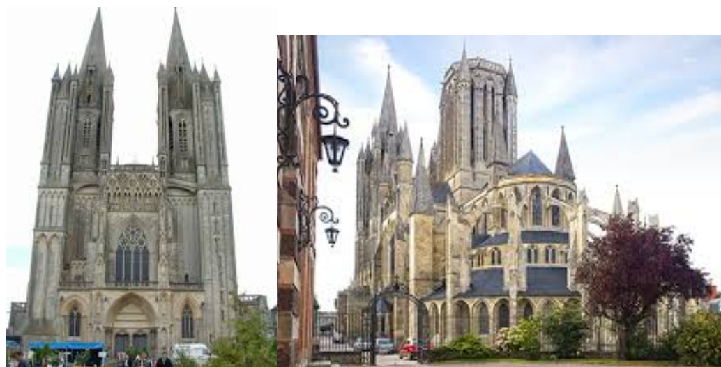
Notre Dame de Coutances - 13ème siècle

Bien différente est Coutances, ville épiscopale, abritant l'une des plus belles cathédrales gothiques normandes, à la somptueuse tour-lanterne. L'église Saint-Pierre, à la flèche renaissance est elle aussi dotée d'une magnifique tour-lanterne, motif typiquement normand