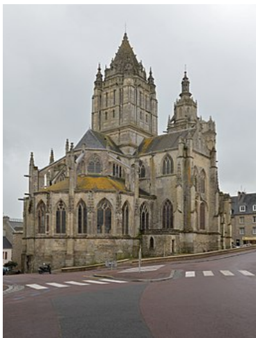
Eglise Saint-Pierre de Coutances

→ Fin des visites vers 16 heures pour le train de 16h35 > Paris 19h48