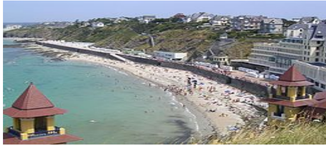
La plage du Plat Gousset Granville

Cité corsaire au XVIIème siècle, la ville fut surnommée au XIXème siècle, la « Monaco du Nord », étant construite sur un isthme caractéristique. La construction du premier casino en bois en 1860 lance les bains de mer. Le quartier balnéaire se développe le long de la plage du Plat Gousset